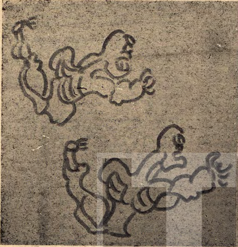
Desen : Yüksel ASLAN